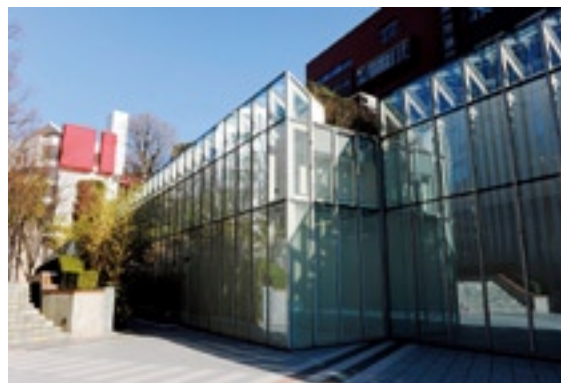
PGFL ビジネスアカデミーセンター