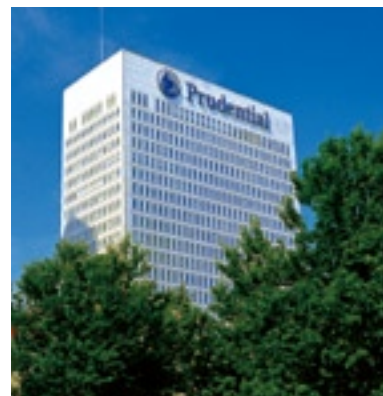
プルデンシャル・ファイナンシャル本社ビル (米国ニュージャージー州ニューアーク市)

プルデンシャル・ファイナンシャルは、自社販売網をはじめとする幅広い販売経路を通じて、世界35カ国以上で、個人、法人のお客さまに、幅広い金融商品とサービスを提供しています。また、生命保険事業については、米国、日本をはじめ、韓国・台湾・イタリア・ポーランド・ブラジル・アルゼンチン・メキシコ・インドで展開しています。