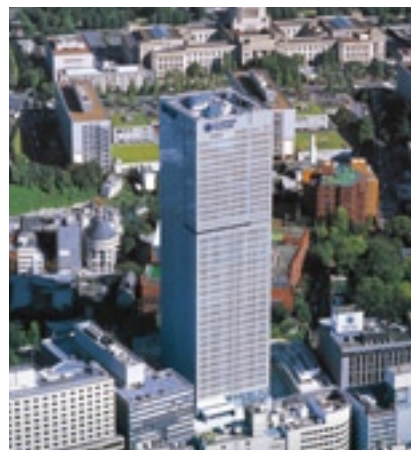
プルデンシャルタワー (東京・永田町)

日本のプルデンシャル・グループにおけるバンカシュアランス（銀行等を通じた生命保険の販売） 専業会社として平成22年8月2日より新契約販売を開始しました。